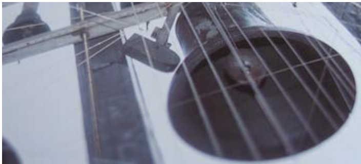
Carillon - Ernst Bonis