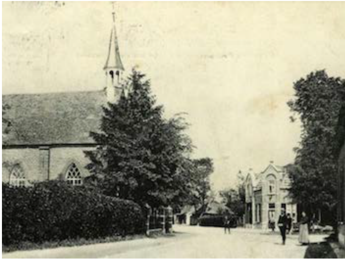
Archive photo: national monument Zaalkerk Budel