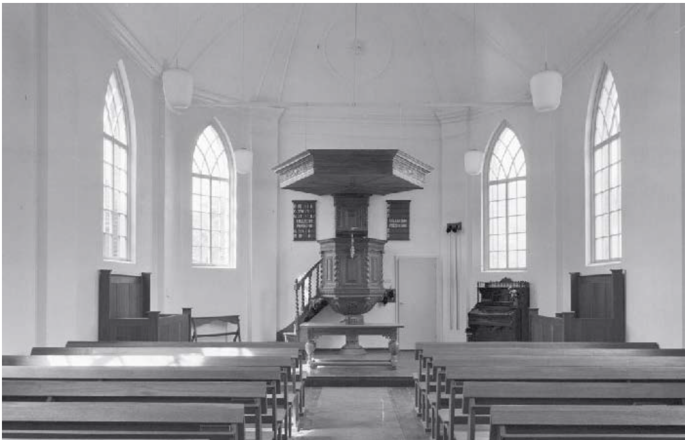
National Monument Zaalkerk Budel