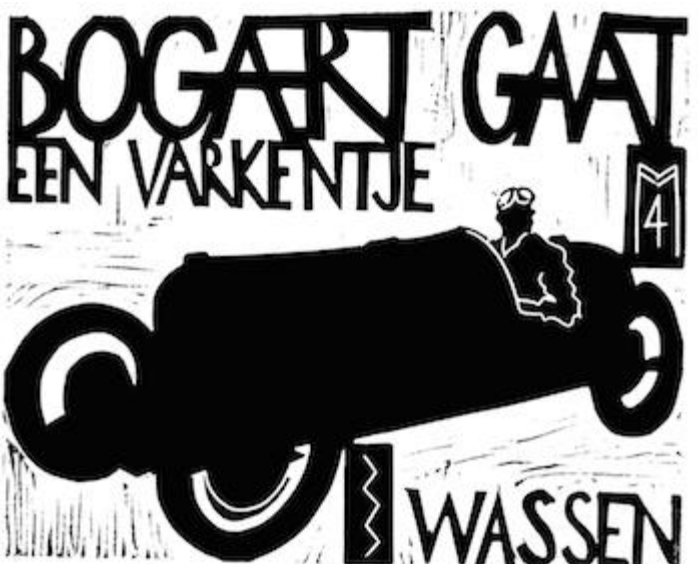
Paul Bogaert lino cut CUBRA