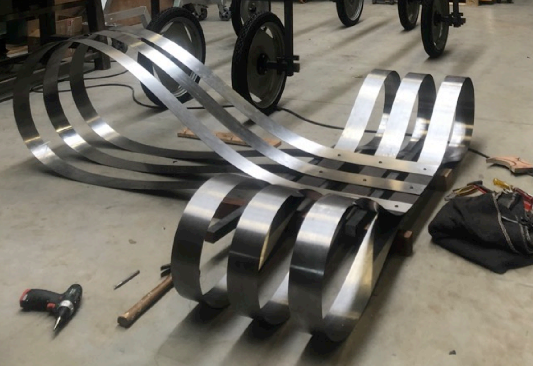
assembly of the spring-steel T in the studio of jan doms