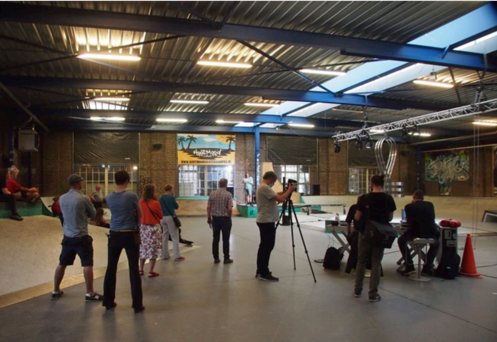
overview ladybird streetpark hall of fame just before the beginning of the performance