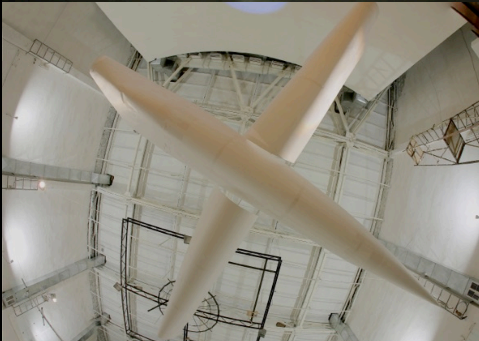
photo: 'glider' in the grand hall armenian center for contemporary experimental art yerevan