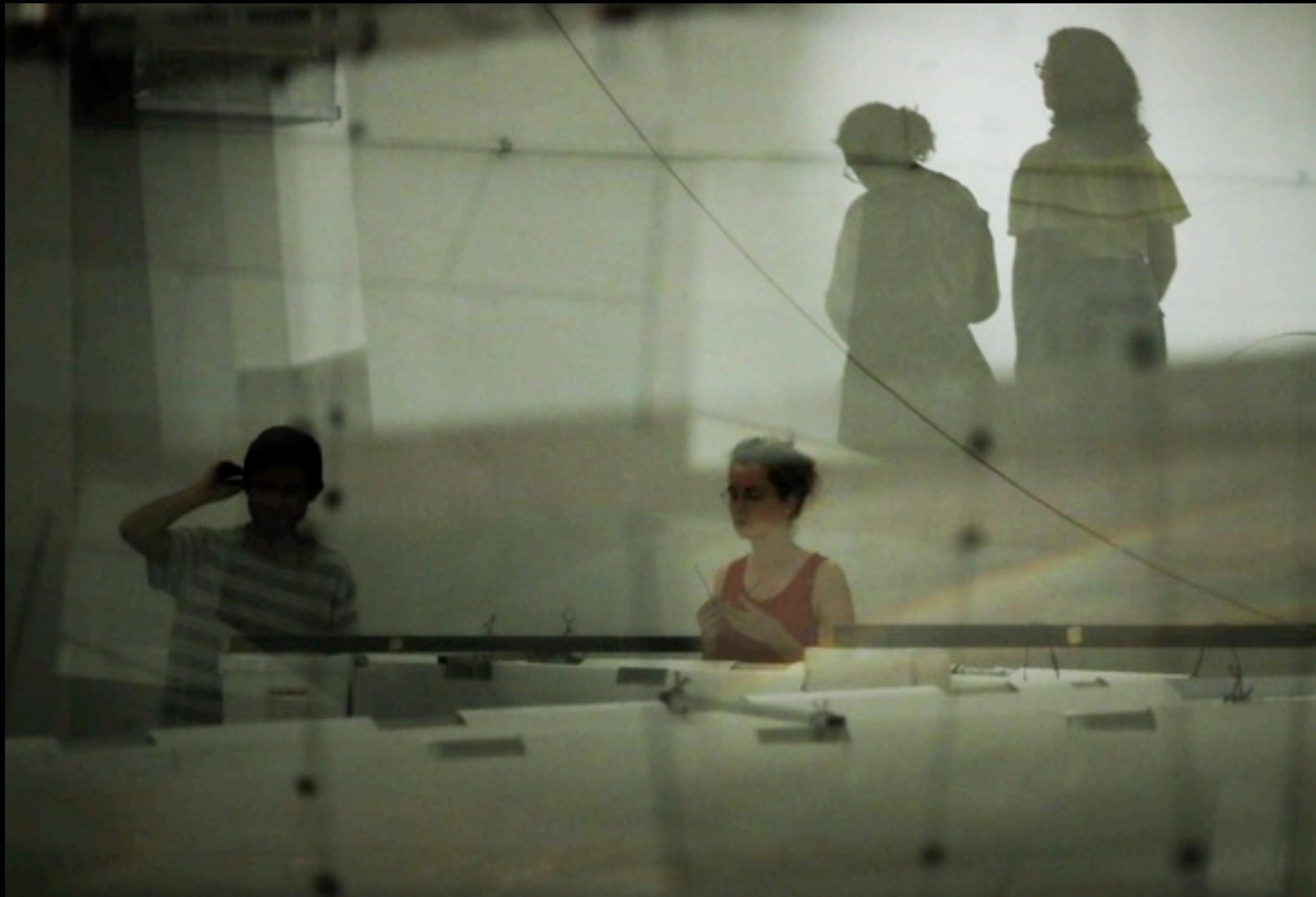
photo: montage 'glider' in the grand hall armenian center for contemporary experimental art yerevan - juliane schreiber and vahagn fereshteyan